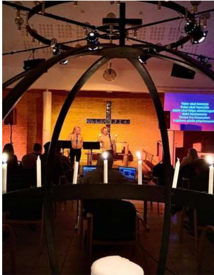
Fra Justvik kirke.